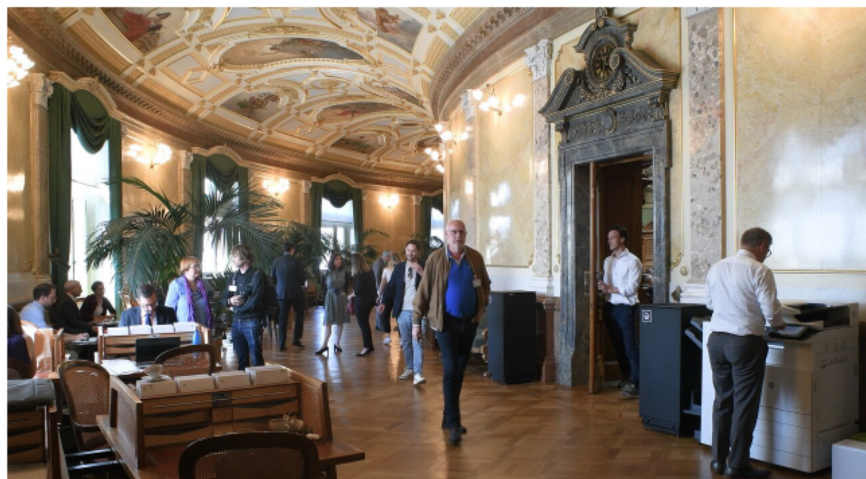
La salle des pas perdus du Palais fédéral, Berne

La salle des pas perdus du Palais fédéral , à Berne, est un lieu central de la vie politique suisse. C'est ici que les politiciennes et politiciens, les lobbyistes et les journalistes se rencontrent pour des entretiens informels. Les nombreuses portes qui s'ouvrent sur la salle du Conseil national et le plafond richement décoré rappellent le foyer d'un théâtre. Telle une petite souris, glissez-vous dans les coulisses des affaires politiques.